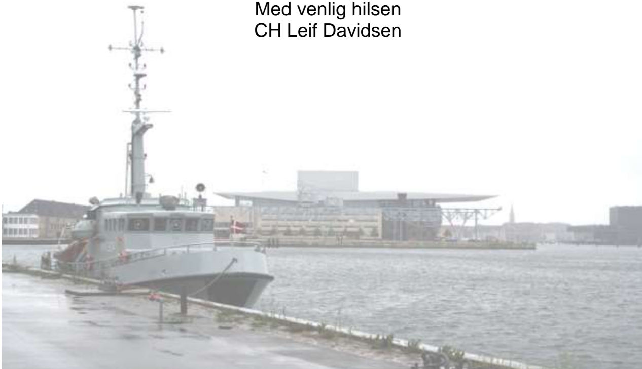
LYØ på Holmen med Operaen i baggrunden.