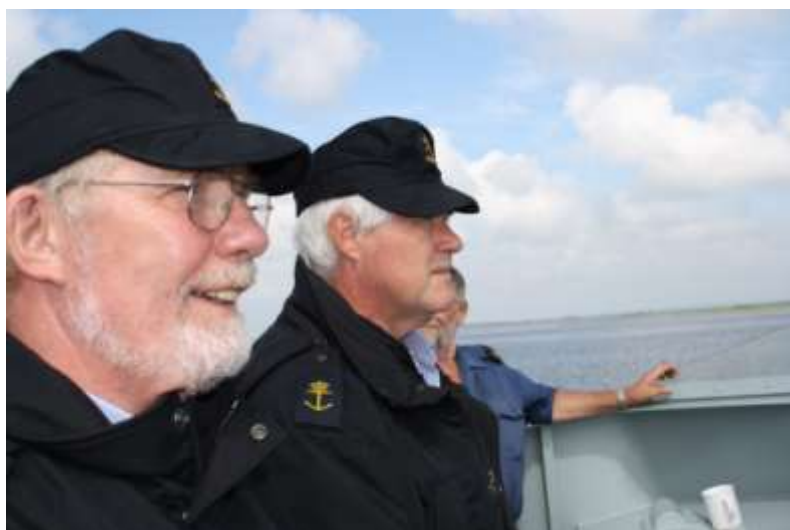
Der bliver holdt et vågent øje fra åben bro

Sommertogtet 2011 har været plaget af uheld og til tider lange kommunikationsveje i systemet, men turen har for mit eget vedkommende været en øjenåbner for, hvad Marinehjemmeværnet kan og hvilket kammeratskab der er ombord. Jeg er godt nok gået glip af porkbombay og Kielerkanalen, men der kommer forhåbentligt et sommertogt på et senere tidspunkt. Jeg vil gerne takke besætningen for nogle gode dage på søen og jeg håber i har nydt de gode stunder, lige så meget som mig.