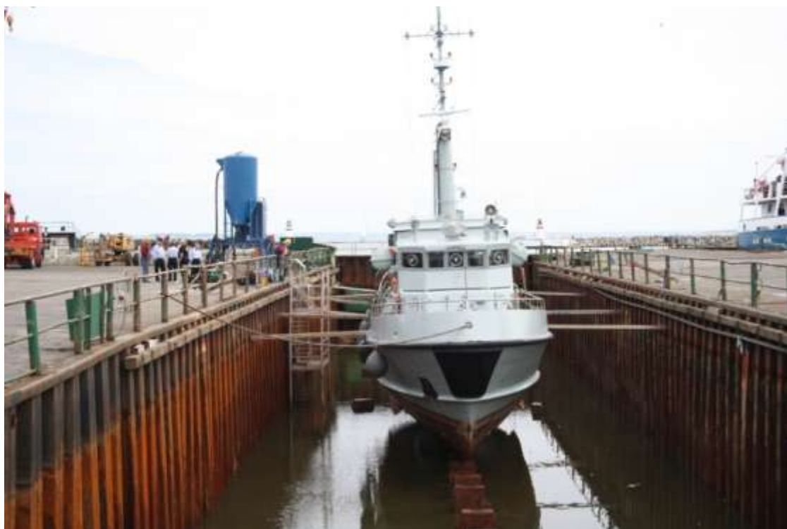
LYØ i et uvant miljø, men desværre en nødvendighed. Tørdokken ved Søby Værft.

besætningen agerer efter rullen, og der var på intet tidspunkt tvivl om, hvad opgaven gik ud på. Efter ny kurs direkte mod Søbyværftet gik sandheden op for besætningen: sommertogtet 2011 var forbi. Vi lagde til i Søbys tørdok og fik "fornøjelsen" af at se hele LYØ.