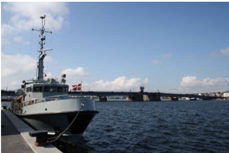
LYØ ved Ålborg havn i solskin med Limfjordsbroen i baggrunden.

diesel. Efter flere opringninger og omdirigeringer i systemet må vi sande, at det at bunkre diesel i vore dage godt kan tage mere end 1 time.